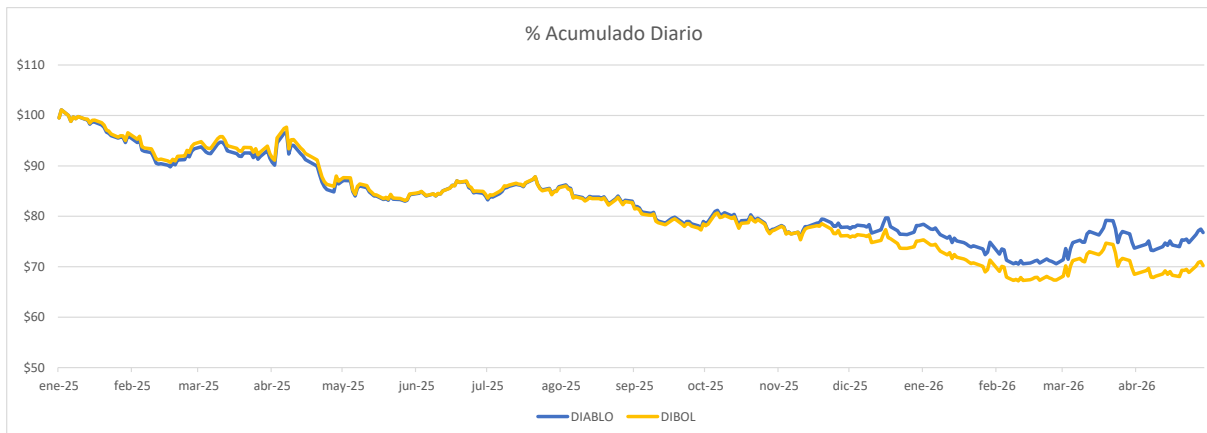
ERROR DE REPLICA