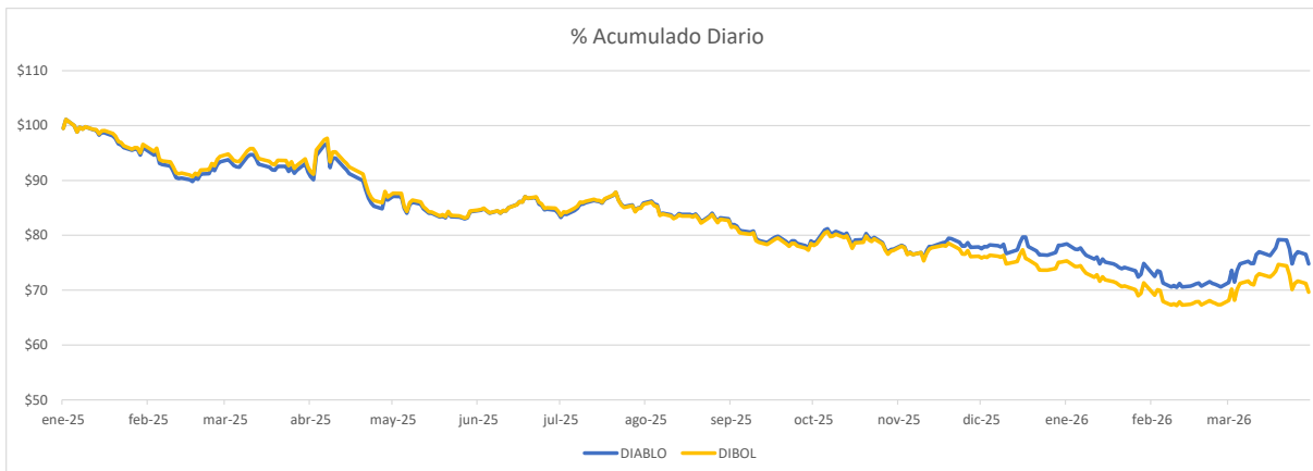
ERROR DE REPLICIA